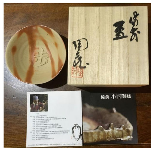
優秀演題賞記念品 備前焼