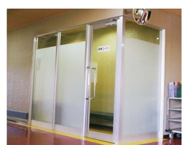
区切られた喫煙室