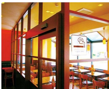
区切られた喫煙席