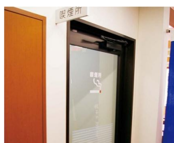
区切られた喫煙室